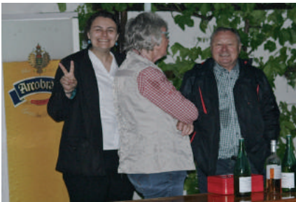
Gute Laune trotz Regen