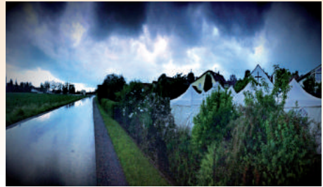
Der Himmel über Otzing am Abend