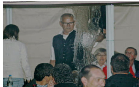
Achtung! Wasser, Marsch in Otzing!